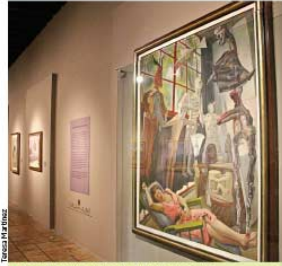
La expo reúne obras de grandes maestros, como "Lucila y las judas", de Diego Rivera.