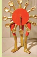
"Reloj astroecológico", de Pedro Friedeberg, presente en la muestra.

La obra "Lucila y las judas", de Diego Rivera, no sólo es una de las obras creadas por uno de los grandes muralistas mexicanos, sino una de las más emblemáticas del acervo de la Secretaría de Hacienda y Crédito Público. El lienzo en el que una mujer recostada está rodeada de figuras folclóricas es una de las piezas que se pueden apreciar en la expo "Acervos artísticos de la Nación", que abrió ayer en el Museo Metropolitano de Monterrey.